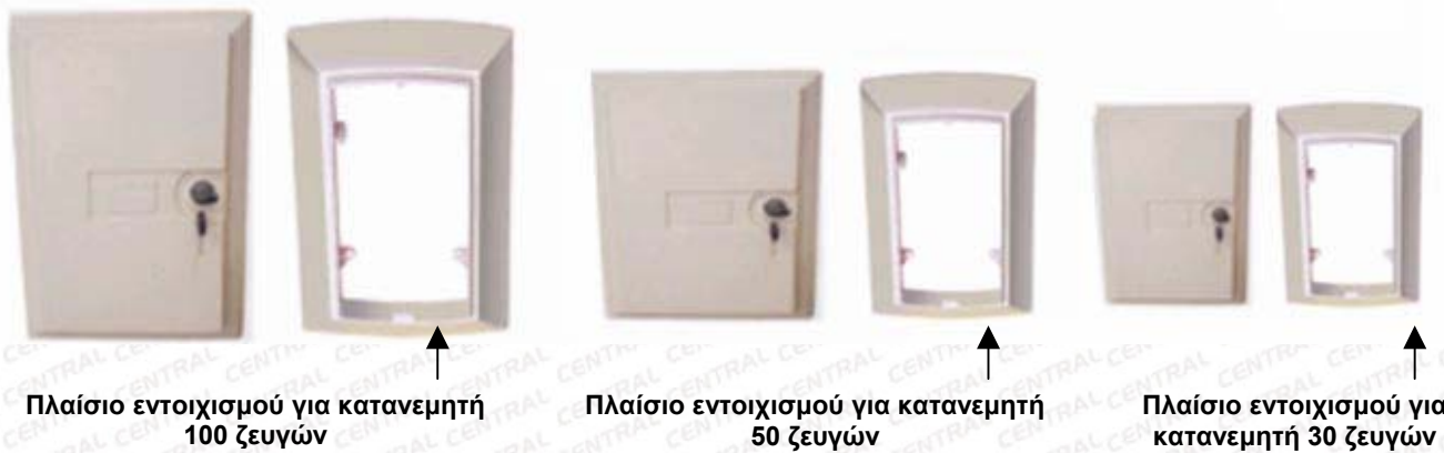
( Σχημ. Απεικόνιση - Τοποθέτηση Κατανεμητή "Διαιρούμενου Τύπου" )